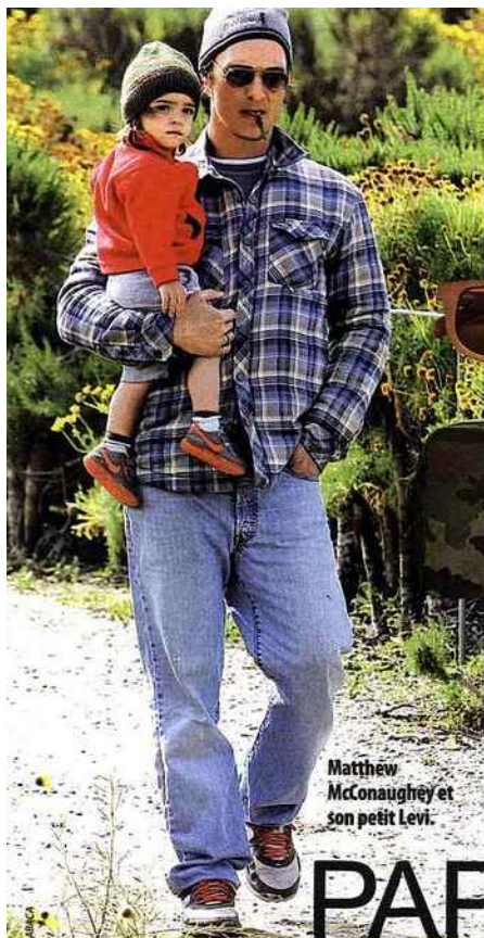
Matthew McConaughey et son petit Levi.