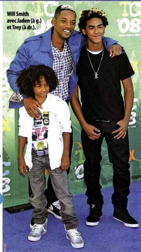
Will Smith avec Jaden (à g.) et Trey (à dr.).

À LA FOIS RELAX ET STREET WEAR, IL JOUE LES COULEURS ACIDULÉES.